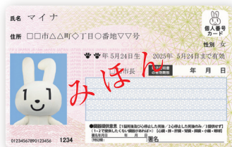
マイナンバーカード